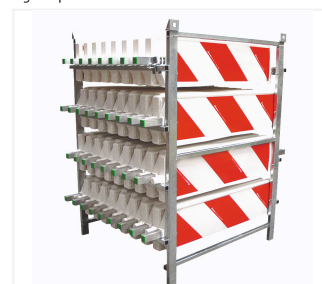
Transport- und Lagergestell