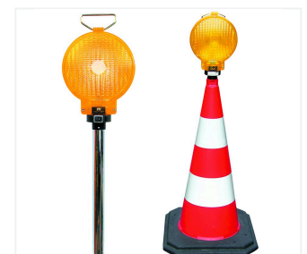
Stab-Leuchte LED Typ 62/S in Leitkegel