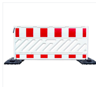
Absperrschrankengitter in Fußplatte