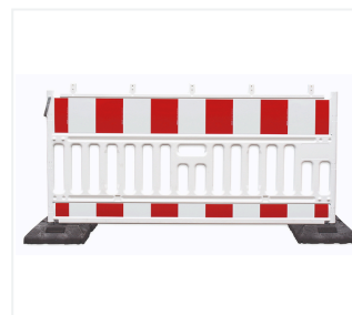
Absperrschrankengitter in Fußplatte