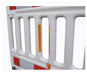
Reflektionsfolie auf Strebe (optional) und Reflektor