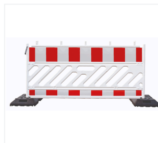
Absperrschrankengitter in Fußplatte

070437-3 070437-3-01 071662-1 082650 002090-5