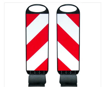
Tornado 50-Flex links- und rechtsweisend