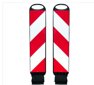
Tornado 75-Flex links- und rechtsweisend