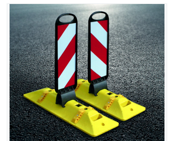
Tornado 50-Flex auf Leitcat-Flex