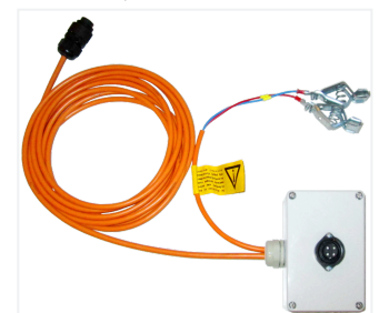
Akku-Mitteleinspeisung mit Anschlussgehäuse