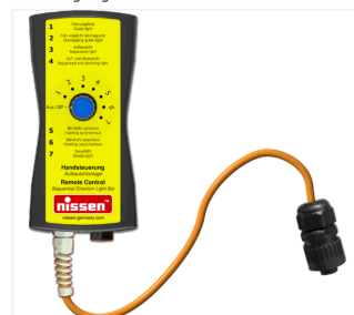
Handsteuerung für Aufbaulichtanlage