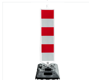
Leitbake waagrecht schraffiert