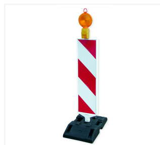
Leitbake mit MonoLight und Fußplatte