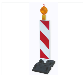
Leitbake mit MonoLight und Fußplatte

* Nur in Verbindung mit TL-Aufstellvorrichtung