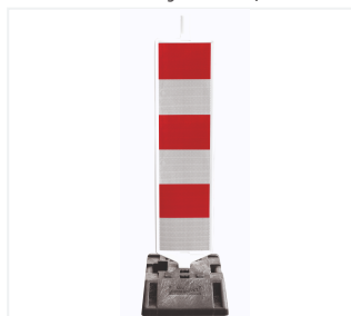
Leitbake waagrecht schraffiert