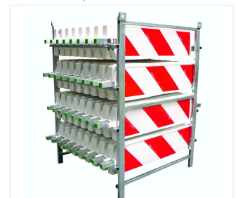
Transport- und Lagergestell