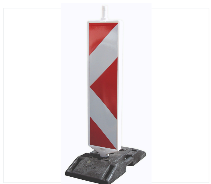
Leitbake in Kompakt K1