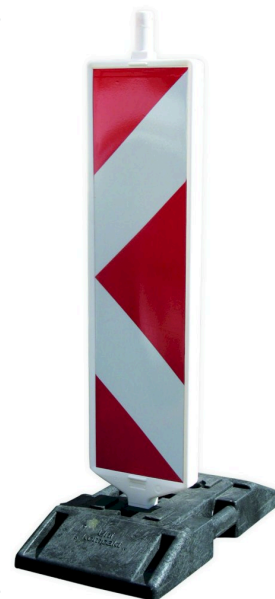
Leitbake in Kompakt K1