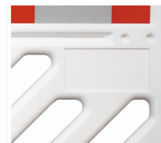
Espacio de publicidad