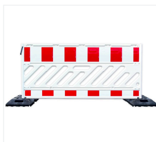
Absperrschrankgitter in Fußplatte