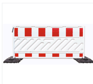
Absperrschrankengitter in Fußplatte