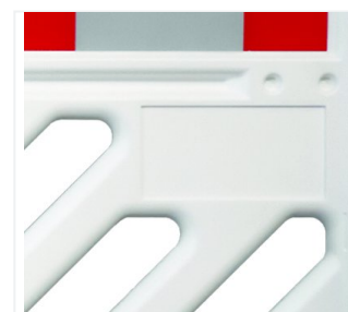
Espacio de publicidad