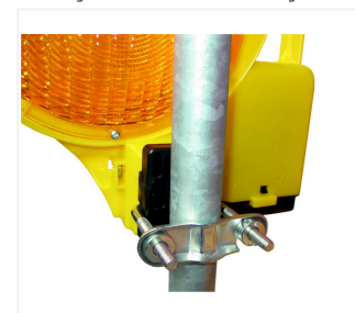
BakoLight con soporte de montaje para postes