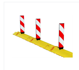
Baliza de seguridad pequeña en Quick Marker