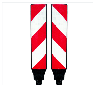
Baliza de seguridad pequeña (Leitmal)