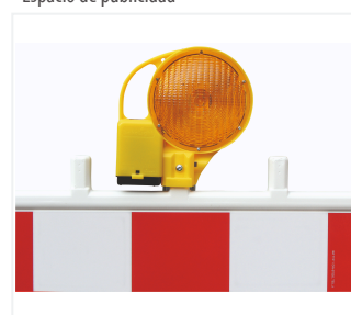
BakoLight en barrera de seguridad