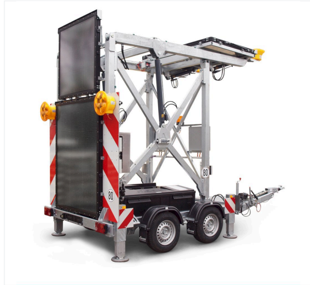
Vista lateral plegado