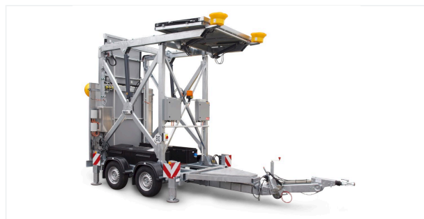
Vista lateral plegado