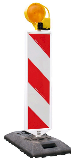
Sistema de balizas de seguridad