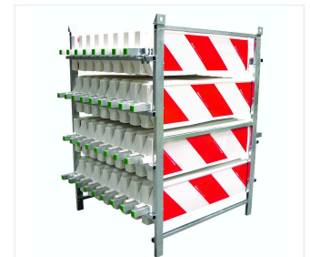
Bastidor de transporte y almacenamiento