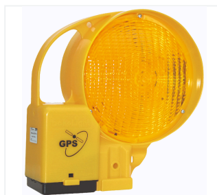
Ensemble à défilement BakoLight LED/S GPS/2