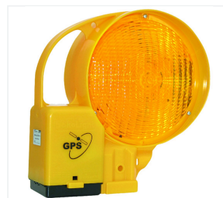
Ensemble à défilement BakoLight LED/S GPS/2