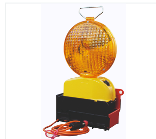
Dans bac de transport et de charge