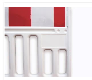
Emplacement publicitaire individuel