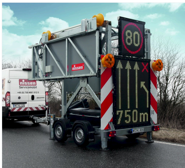
Position de transport