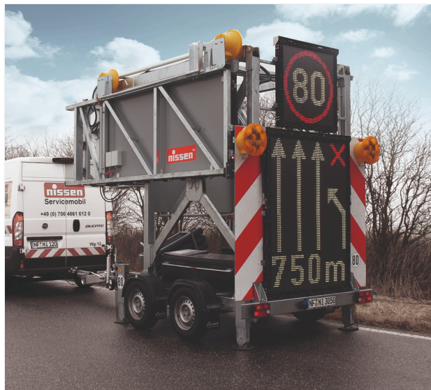
Position de transport