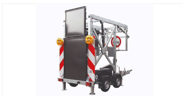
Vue de côté