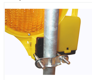
BakoLight avec fixation pour mât