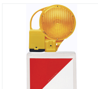
BakoLight sur balise