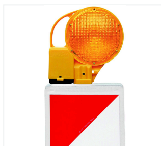
BakoLight sur balise