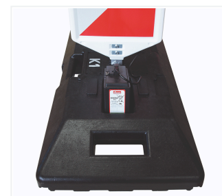
Compartment pour pile