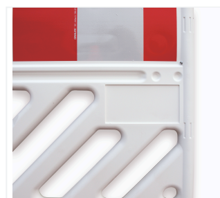
Emplacement publicitaire individuel