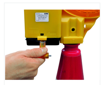
Remplacement de la pile