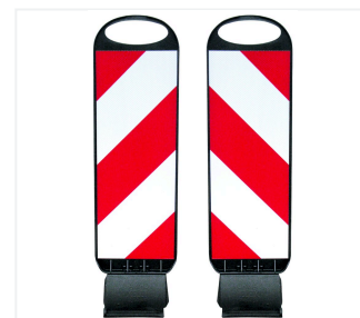
Tornado 50-Flex gauche et droite