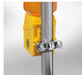
MonoLight avec fixation pour mât