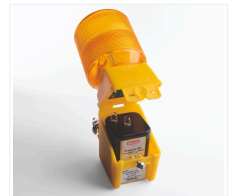
Remplacement de la pile