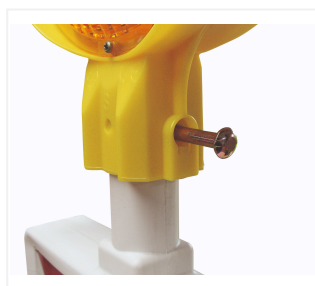
Fixation sur balise standard