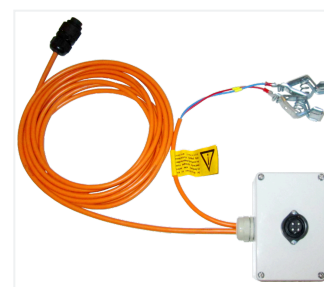
Alimentation centrale de l'accu avec boîtier de branchement