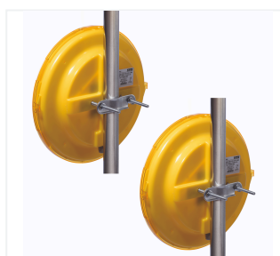
Ensemble double feu avec fixation