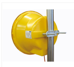
Lampe pré-avertisseur avec fixation