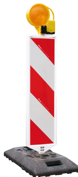
Ensemble de balisage de sécurité