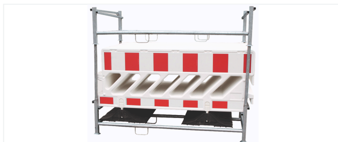
Transport- und Lagergestell