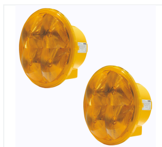
Imp. segn. a due lamp. Multi-Light 340 LED FI

con accumulatore 12 V, 100 Ah 750 ore con accumulatore 12 V, 180 Ah 1500 ore