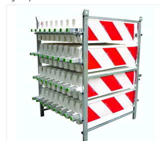
Transport- und Lagergestell