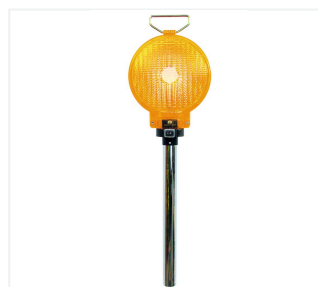
Lampada ad asta LED tipo 62/S