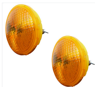
Imp. segn. a due lamp. Zyklop 220 LED Flash L: