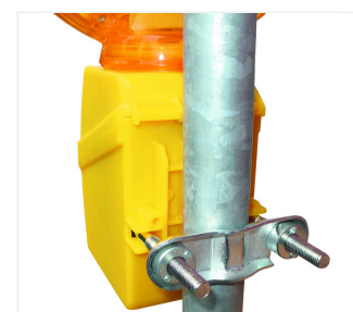
MonoLight con staffa di fissaggio