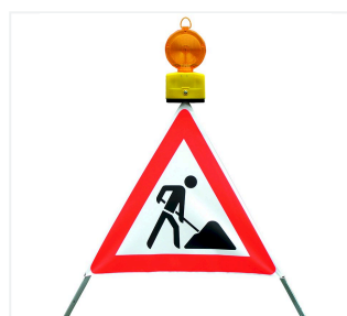
Nitra LED su segnale pieghevole