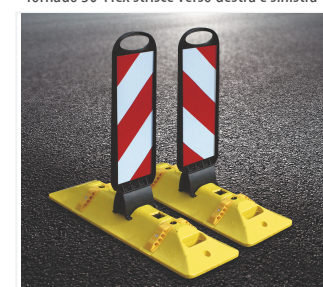
Tornado 50-Flex su Leitcat-Flex