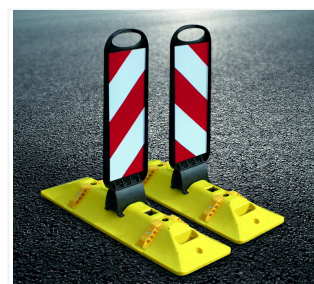
Tornado 50-Flex su Leitcat-Flex