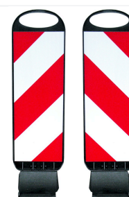
Tornado 50-Flex strisce verso destra e sinistra