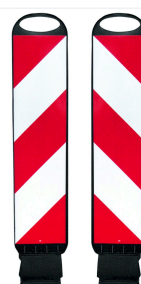
Tornado 75-Flex strisce verso destra e sinistra