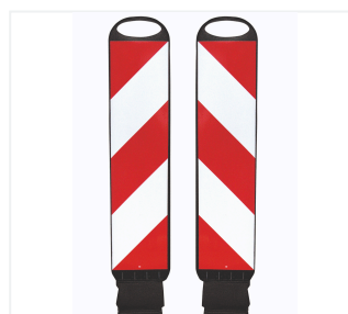
Tornado 75-Flex strisce verso destra e sinistra