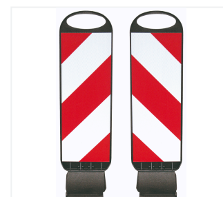
Tornado 50-Flex strisce verso destra e sinistra