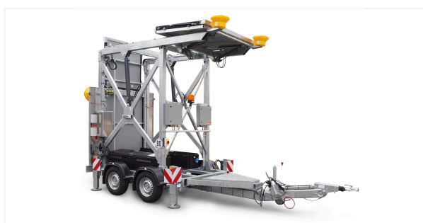
Vista laterale chiusa