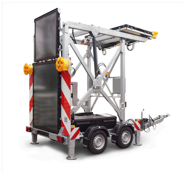
Vista laterale chiusa