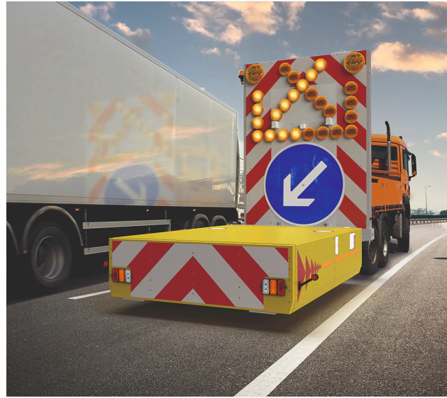
Standard Remote ColourDefender in uso