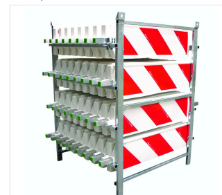
Contenitore di trasporto e stoccaggio