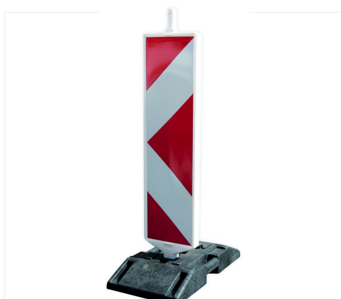
Pannello di delimitazione in Kompakt K1