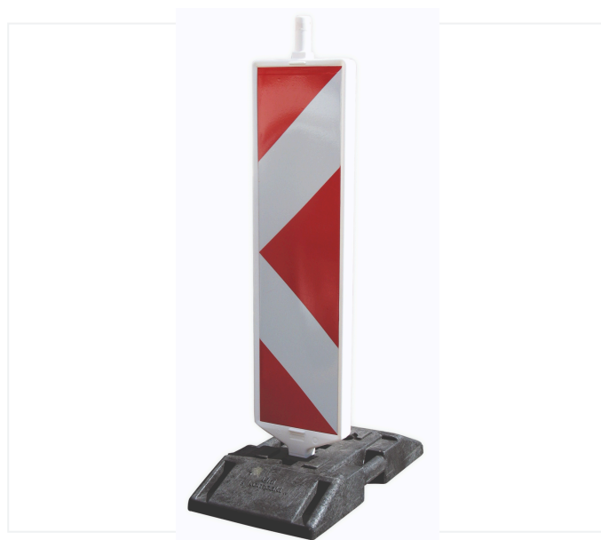
Pannello di delimitazione in Kompakt K1