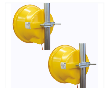
Podwójny system lamp ostrzegawczych z uchwytem