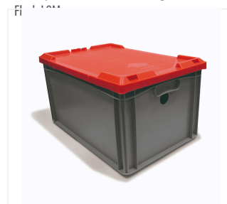
Pojemnik na akumulator