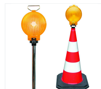
Lampa z trzonkiem LED typu 62/S na pachołku