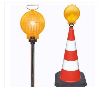
Lampa z trzonkiem LED typu 62/S na pachołku