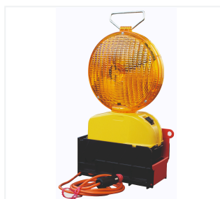
W pojemniku do transportu i ładowania