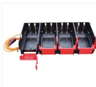
4-krotny pojemnik do transportu i ładowania