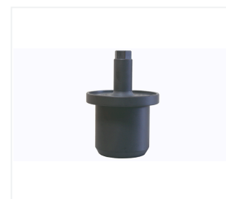
Adapter do pachółka