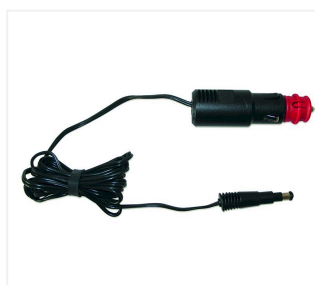
Kabel do ładowania