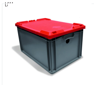
Pojemnik na akumulator