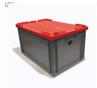
Pojemnik na akumulator