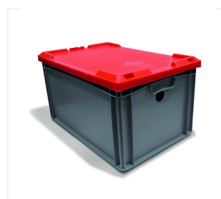
Pojemnik na akumulator