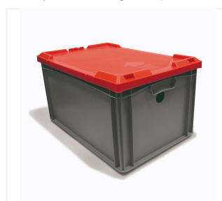
Pojemnik na akumulator