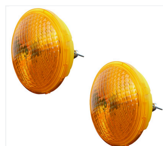
Podwójna lampa ostrzegawcza Zyklop 220

z akumulatorem 12 V, 100 Ah 440 godz. z akumulatorem 12 V, 180 Ah 800 godz. z akumulatorem 12 V, 230 Ah 1000 godz.