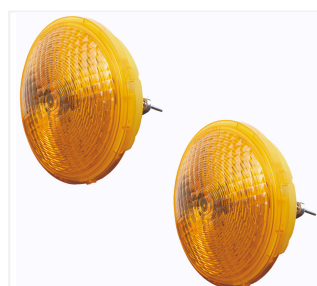
Podwójna lampa ostrzegawcza Zyklop 220