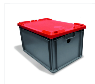
Pojemnik na akumulator